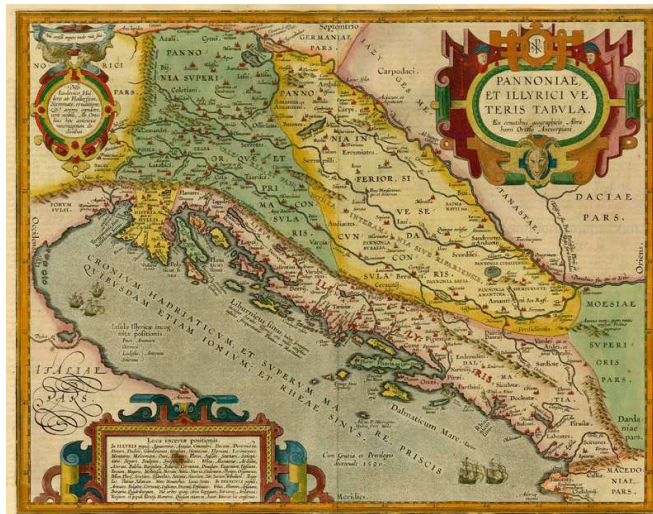
Strídon, na fronteira entre a Panónia e a Dalmácia

(Strídon, c. 347 - Belém, 30 de Setembro de 420), nascido EusébioSofrônio (Sofrônio) Jerónimo (em latim: Eusebius Sophronius Hieronymus ; em grego: Εὐσέβιος Σωφρόνιος Ἱερώνυμος) foi um padre apologista cristão ilírio. É conhecido sobretudo como tradutor da Bíblia do grego antigo e do hebraico para o latim. A edição de São Jerónimo, a Vulgata , é ainda o texto bíblico oficial da Igreja Católica Romana, que o reconhece como Padre da Igreja (um dos fundadores do dogma católico) e ainda doutor da Igreja. Nasceu em Strídon, na fronteira entre a Panónia e a Dalmácia (motivo pelo qual também é chamado de Jerónimo de Strídon ), no segundo quarto do século IV .